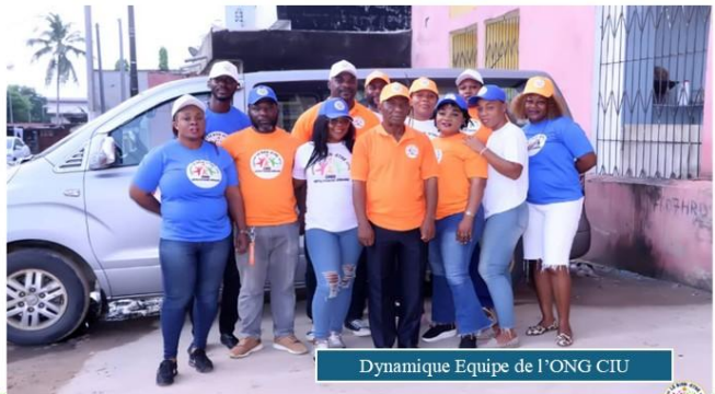
Dynamique Equipe de l'ONG CIU