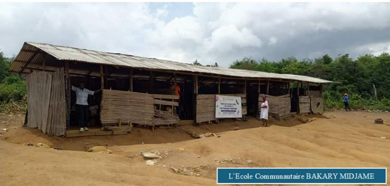
L'Ecole Communautaire BAKARY MIDJAME