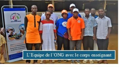
L'Equipe de l'ONG avec le corps enseignant