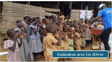
Animation avec les élèves