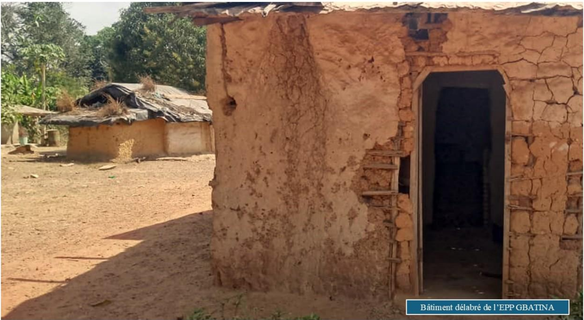
Bâtiment délabré de l'EPP GBATNA