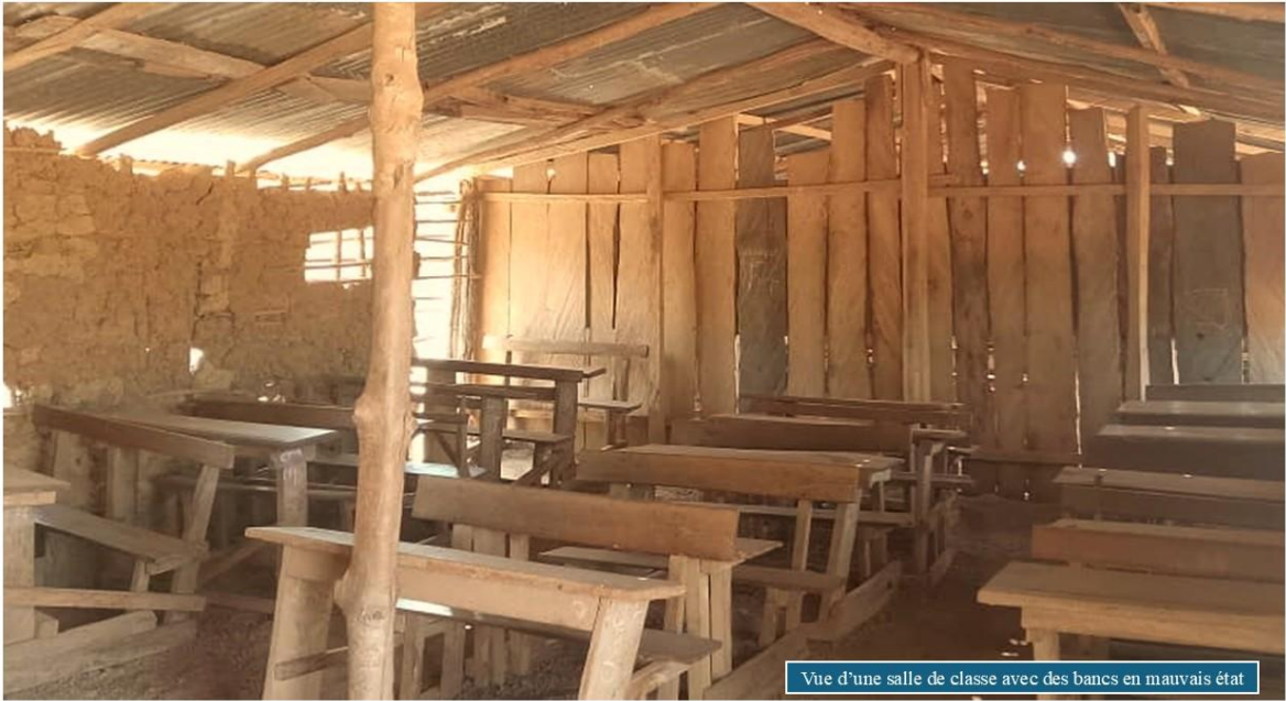
Vue d'une salle de classe avec des bancs en mauvais état