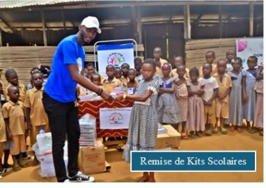
Remise de Kits Scolaires