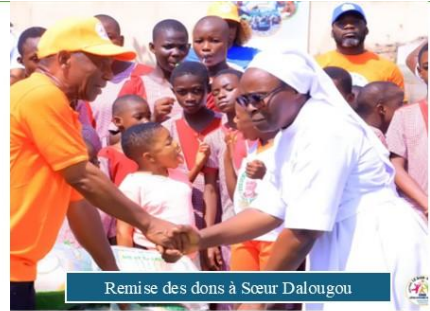
Remise des dons à Sœur Dalougu