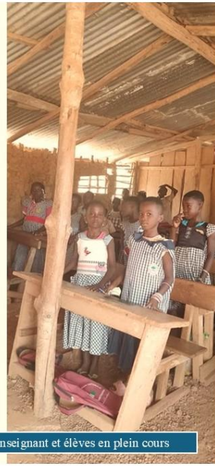
Enseignant et élèves en plein cours