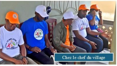
Chez le chef du village