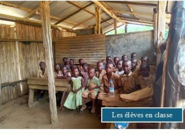
Les élèves en classe